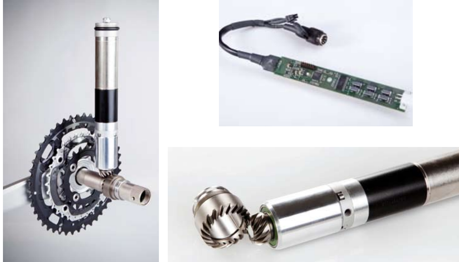
FIGURE 2 – Photographies de quelques éléments du Bibax Assist