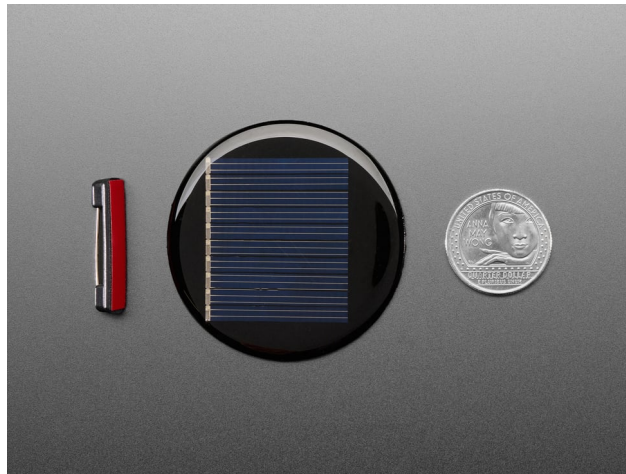
FIGURE 2 – Cellule photovoltaïque utilisée pour la récupération d'énergie. L'élément à gauche est un support adhésif vendu par le distributeur pour faciliter la fixation de la cellule.